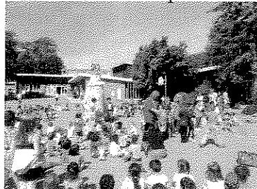
Métropole Culture en 2014

L'observation de la faune (animaux de l'école et de leurs petits) et de la flore de l'école avec comme personne de référence, notre concierge.