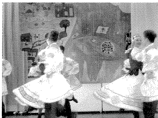
Danseurs Biélorusses venant de Tchernobyl