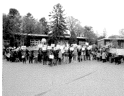
Attentats de Paris en novembre 2015

d) La lecture et son apprentissage seront mis à l'honneur dans tous les cycles.